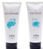
PAKET 14 FOTVÅRDSPAKET 1 x 100 ml Fotkräm 1 x 100 ml Fotskrubb