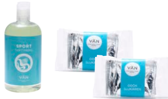
PAKET 9 TVÄTTPAKET 2 1 x 500 ml Sporttvättmedel 2 x Odörlukare