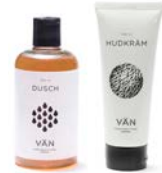
PAKET 13 HUDVÅRD ORIGINAL 1 x 300 ml Duschkräm 1 x 100 ml Hudkräm