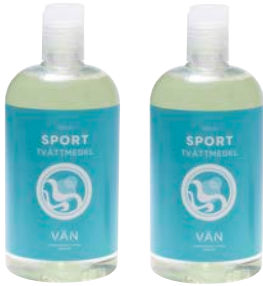
PAKET 8 TVÄTTPAKET 2 x 500 ml Sporttvättmedel