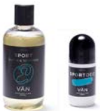
PAKET 11 DUSCHPAKET SPORT 1 x 250 ml Sportdusch 1 x 50 ml Deo Sport