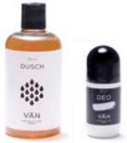
PAKET 10 DUSCHPAKET ORIGINAL 1 x 300 ml Duschkräm 1 x 50 ml Deo