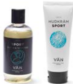
PAKET 12 HUDVÅRD SPORT 1 x 250 ml Sportdusch 1 x 100 ml Hudkräm Sport